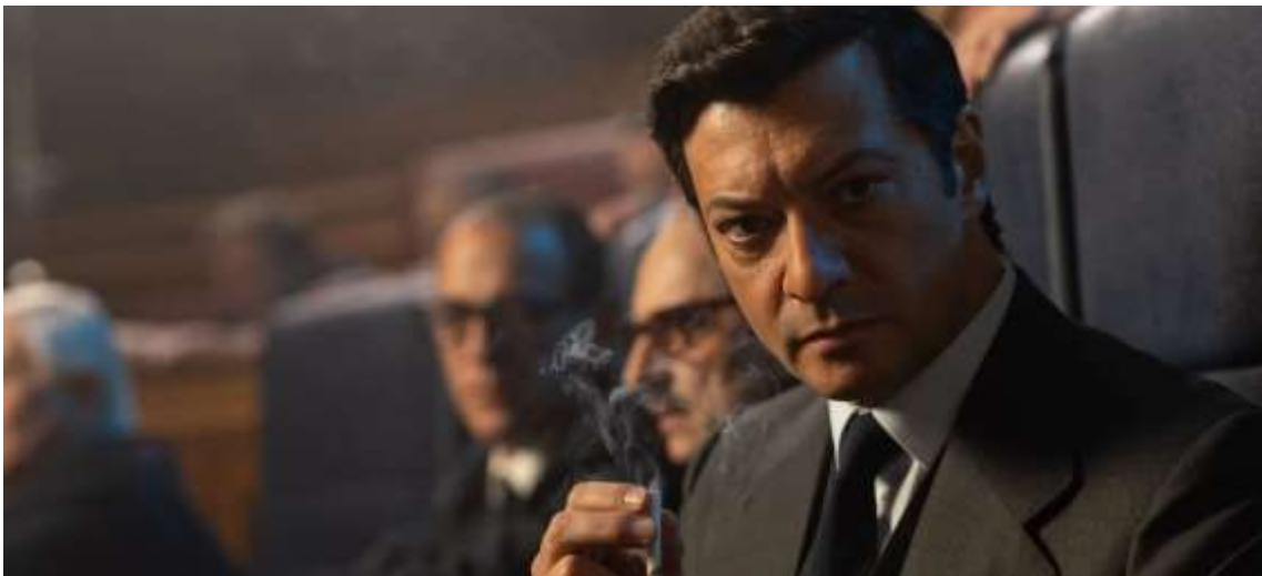
Álvaro Morte, en 'Anatomía de un instante' de Movistar Plus+

La nueva serie relata el intento de golpe de Estado del 23 F y su fecha de estreno es muy representativa